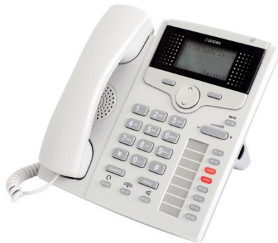
CTS-220.CL / 220.IP